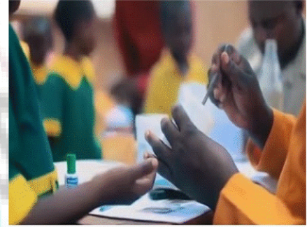
International Day of Charity

(A) अंतर्राष्ट्रीय चैरिटी दिवस 5 सितंबर को प्रतिवर्ष मनाया जाता है। इसे 2012 में संयुक्त राष्ट्र ने कलकता में हुए मदर टेरेसा के निधन की वर्षगांठ को चिन्हित करने के लिए अंतर्राष्ट्रीय चैरिटी दिवस के रूप में घोषित किया था। 5 सितंबर को मदर टेरेसा की पुण्यतिथि मनाने के लिए चुना गया था, जो हमेशा धर्मार्थ कार्यों में लगी रही।