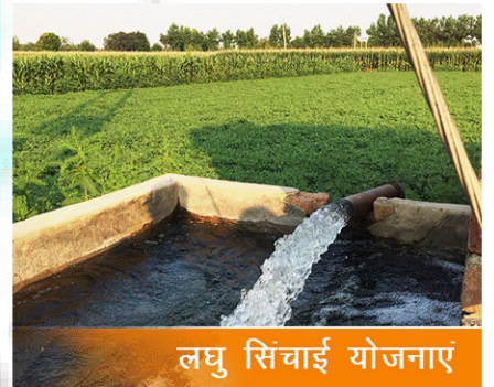
लघु सिंचाई योजनाएं

(C) देश में सबसे अधिक लघु सिंचाई योजनाएं उत्तर प्रदेश में हैं। इसके बाद महाराष्ट्र, मध्य प्रदेश, तमिलनाडु और तेलंगाना है। सतही जल योजनाओं में महाराष्ट्र, कर्नाटक, तेलंगाना, ओडिशा और झारखंड की हिस्सेदारी सबसे अधिक है। भूजल योजनाओं में खोदे गए कुएं, कम गहरे ट्यूबवेल, मध्यम ट्यूबवेल और गहरे ट्यूबवेल शामिल हैं।